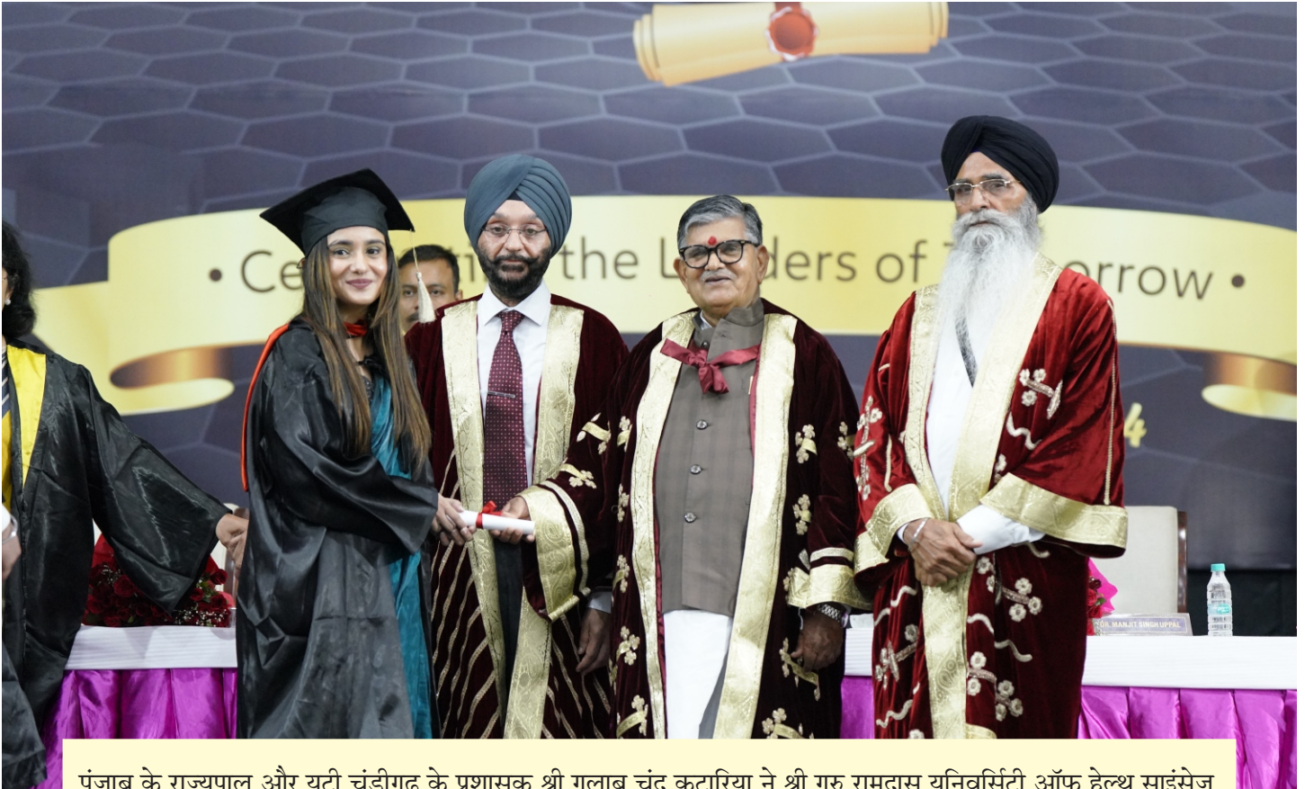
पंजाब के राज्यपाल और यूटी चंडीगढ़ के प्रशासक श्री गुलाब चंद कटारिया ने श्री गुरु रामदास यूनिवर्सिटी ऑफ हेल्थ साइंसेज, अमृतसर के दीक्षांत समारोह में 542 स्नातक और स्नातकोत्तर विद्यार्थियों को डिग्री प्रदान की।