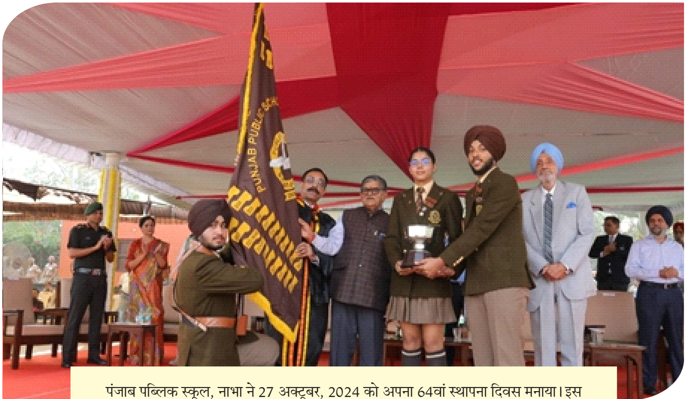
पंजाब पब्लिक स्कूल, नाभा ने 27 अक्टूबर, 2024 को अपना 64वां स्थापना दिवस मनाया। इस समारोह की अध्यक्षता पंजाब के राज्यपाल और यूटी चंडीगढ़ के प्रशासक श्री गुलाब चंद कटारिया ने की।