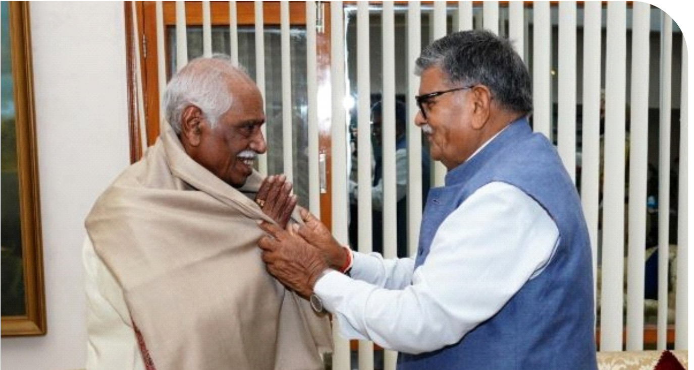
हरियाणा के राज्यपाल श्री बंडारू दत्तात्रेय पंजाब राजभवन, चंडीगढ़ में पंजाब के राज्यपाल और केंद्र शासित प्रदेश, चंडीगढ़ के प्रशासक श्री गुलाब चंद कटारिया से शिष्टाचार भेंट करते हुए।