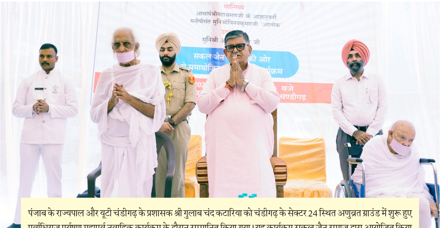
पंजाब के राज्यपाल और यूटी चंडीगढ़ के प्रशासक श्री गुलाब चंद कटारिया को चंडीगढ़ के सेक्टर 24 स्थित अणुव्रत ग्राउंड में शुरू हुए पर्याधिराज पर्युषण महापर्व नवाहिक कार्यक्रम के दौरान सम्मानित किया गया। यह कार्यक्रम सकल जैन समाज द्वारा आयोजित किया गया था, जहाँ पंजाब के सभी चार समुदाय इस पवित्र अवसर को मनाने के लिए एकजुट हुए। श्री कटारिया ने जैन धर्म के 2600 साल पुराने इतिहास पर विचार किया, इसके अनूठे दर्शन का उल्लेख किया जहाँ व्यक्ति अक्सर आध्यात्मिक ज्ञान की खोज में सांसारिक संपत्ति का त्याग करते हैं।