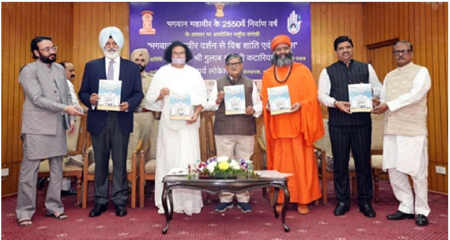
पंजाब राजभवन ने जैन धर्म के 24वें तीर्थंकर भगवान महावीर की 2550वीं निर्वाण वर्षगांठ पर “भगवान महावीर के दर्शन के माध्यम से वैश्विक शांति और विकास” विषय पर एक राष्ट्रीय संगोष्ठी का आयोजन किया।