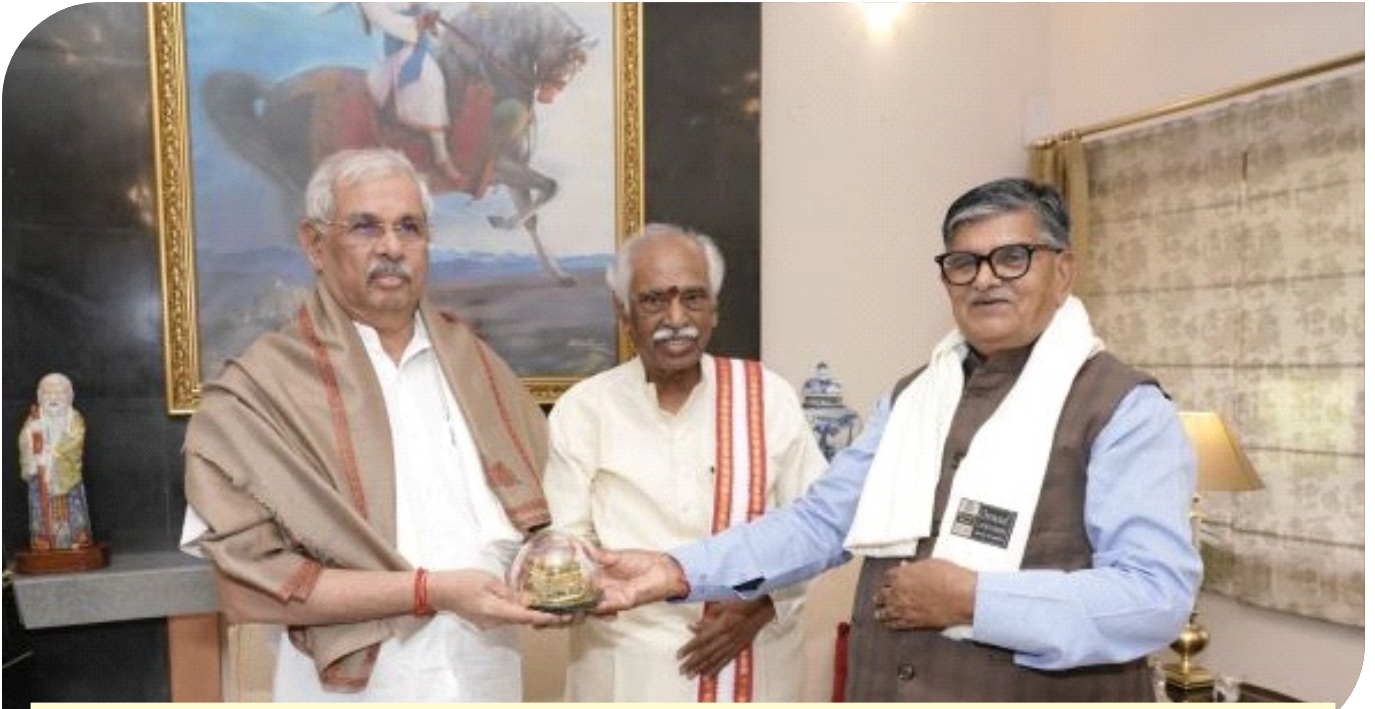
पंजाब के राज्यपाल और केंद्र शासित प्रदेश चंडीगढ़ के प्रशासक श्री गुलाब चंद कटारिया, बिहार के राज्यपाल श्री राजेंद्र विश्वनाथ अर्लेकर और हरियाणा के माननीय राज्यपाल श्री बंडारू दत्तात्रेय के साथ पंजाब राजभवन में शिष्टाचार भेंट करते हुए।