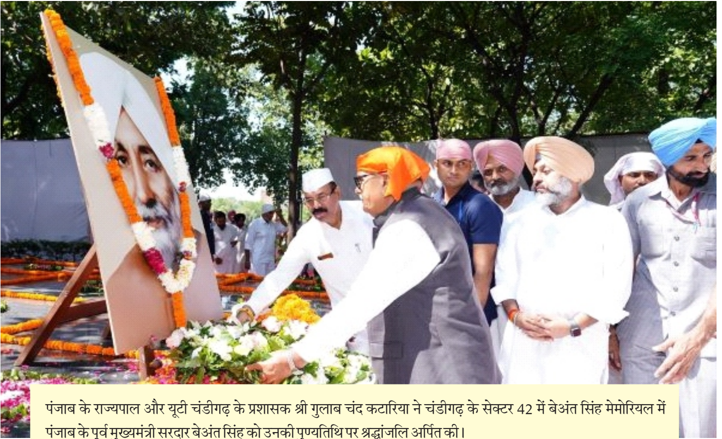
पंजाब के राज्यपाल और यूटी चंडीगढ़ के प्रशासक श्री गुलाब चंद कटारिया ने चंडीगढ़ के सेक्टर 42 में बेअंत सिंह मेमोरियल में पंजाब के पूर्व मुख्यमंत्री सरदार बेअंत सिंह को उनकी पुण्यतिथि पर श्रद्धांजलि अर्पित की।